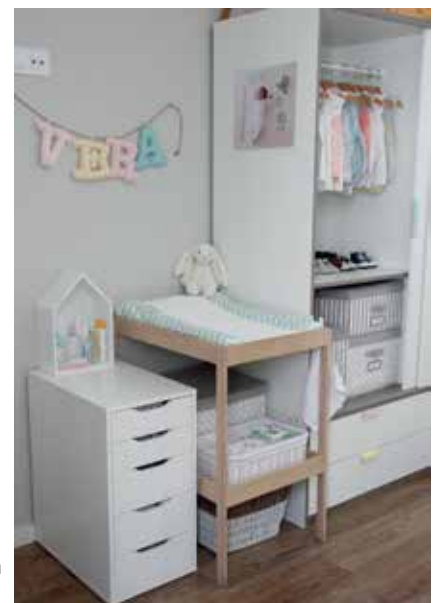
Colores claros. Para un bebé, se aconsejan los muebles en blanco y madera natural.

Cuando se está pensando en la habitación de un bebé, el espacio destinado al cambiador exige una atención especial, dadas las veces que se va a utilizar a lo largo del día. Entre las recomendaciones que dan desde la tienda online La caseta coqueta (@lacasetacoqueta en Instagram) cabe destacar “tener el armario de ropa pegado al cambiador y así poder acceder a las prendas del bebé sin tener que movernos del sitio”. También resulta muy práctico si al otro lado colocas una cómoda con cajones para la ropa interior (peucos, ranitas, calcetines, bodies , etc). En cuanto al cambiador propiamente, un compartimento inferior se hace necesario para almacenar y tener fácil acceso a los productos indispensables, como pañales, toallitas, cremas, colonia, etc., “ya que a veces contamos solo con una mano para poder cogerlos”.