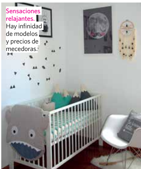
Sensaciones relajantes. Hay infinidad de modelos y precios de mecedoras.

Aprovecha el espacio Cada rincón de un dormitorio infantil ofrece múltiples posibilidades de uso y disfrute según la edad y sus necesidades