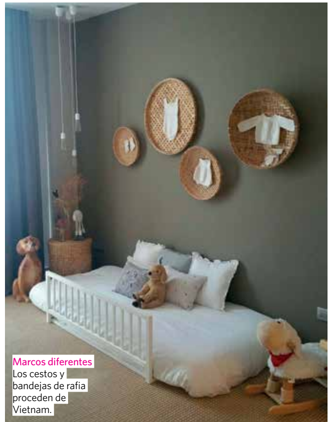
Marcos diferentes Los cestos y bandejas de rafia proceden de Vietnam.

El proyecto de este dormitorio infantil firmado por la interiorista catalana centra la atención en otro foco, la cama, colocada a ras de suelo "para evitar caídas durante la noche, pero a la vez para que funcione como sofá o zona de relax a la altura de los niños durante el día". La barandilla se sujeta directamente por el peso del colchón, "evitando crear agujeros por los que se podría colar".