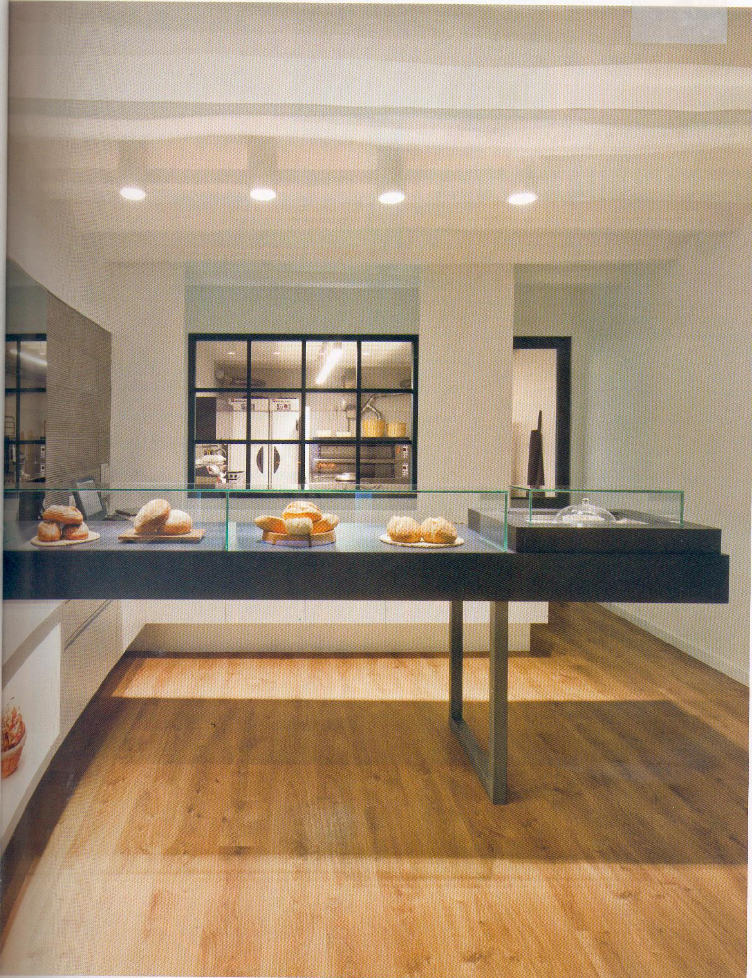
La tienda se pinta de blanco para dar sensación de pureza. El volumen del mostrador, en dm negro, resalta el pan que se fabrica en el obrador.